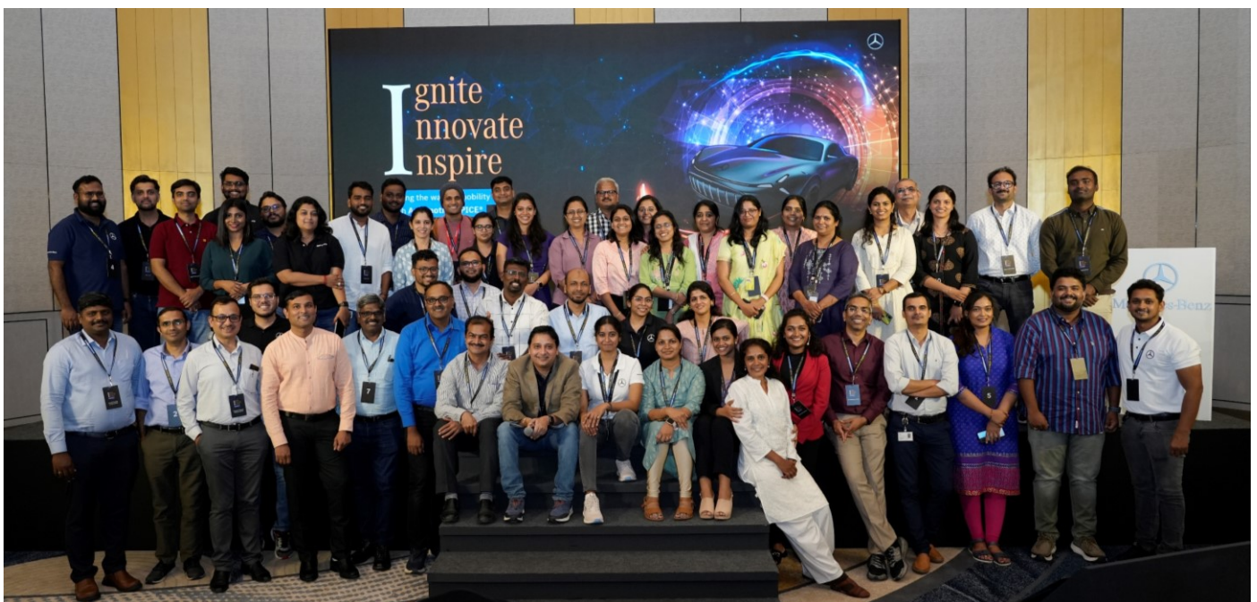
图3: Gate4SPICE 参与者参加在班加罗尔（印度）举行的为期两天的活动。

这个为期两天的活动汇聚了全球评估师社团，以共享知识，共同理解与SPICE相关的话题，同时也促进持续改进的文化。这个平台还专注于提升汽车软件的质量，通过加速行业对汽车软件安全性和可靠性的关注。参与者包括来自不同汽车供应商和整车厂（OEM）的Provisional、Competent和Principal的AUTOMOTIVE SPICE®评估师，以及MBRDI内部各部门的领导者。